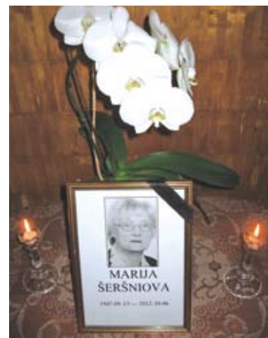
Lentvario I vidurinėje mokykloje pagerbtas žuvusios mokytojos atminimas

Viena lentvariške pasakojo, kad tą vakarą, kai ji iš sodų bendrijos „Kilimai“ ėjo į namus Vandėnų gatvė, irgi vos spėjo pasitraukti į šalį, nes pašėlusiu greičiu į sodininkų bendriją važiavo automobilis. Ji mano, kad tai galėjo būti avarijos kaltininkas.