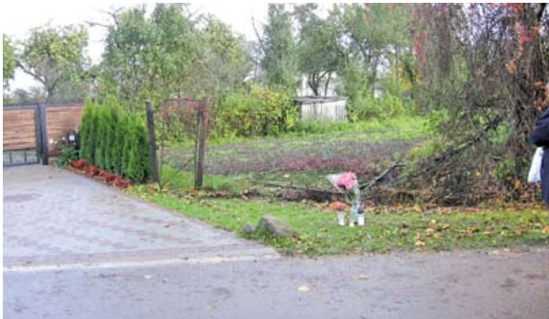
Mokytoja žuvo partrenkta automobilio šalia savo namų