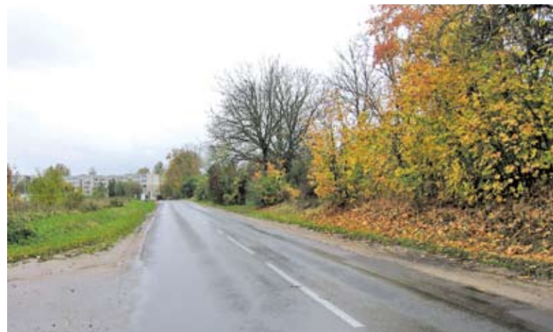
Gatvė eiti sodininkų bendrijos „Kilimai“ link pavojinga, nes nėra šaligatvio

Trakų rajono policijos komisariato pareigūnai intensyviai ieško šeštadienio vakare Lentvario sodininkų bendrijos „Kilimai“ teritorijoje partrenkusio ir mirtinai sužalojusio moterį automobilio vairuotojo