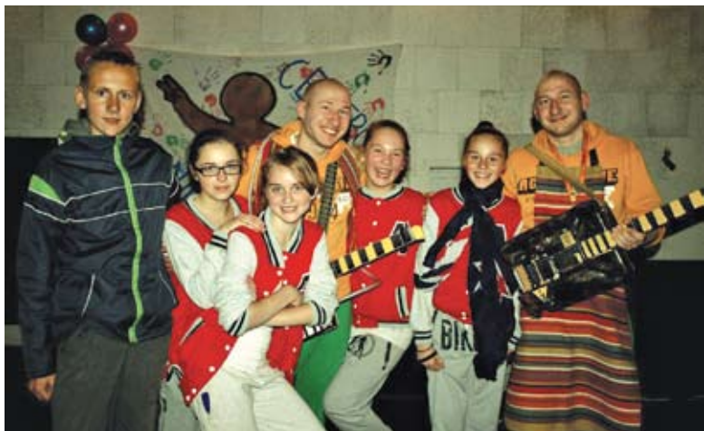
Naujai susikūrusi mažųjų šokių grupė „A-team“ drauge su „Timohi“

Praeito penktadienio pavakarė sukvietė Lentvario jaunimą pajudėti, kadangi vyko tradiciniu tapęs renginys „Gatvės ritmu 2012“. Iš buvusios kino teatro salės sklidusi garsi muzika ir džiaugsmo šūkiu pranešė Lentvariumi džiugią žinią: „Jaunimas laisvalaikį leidžia turiningai!“