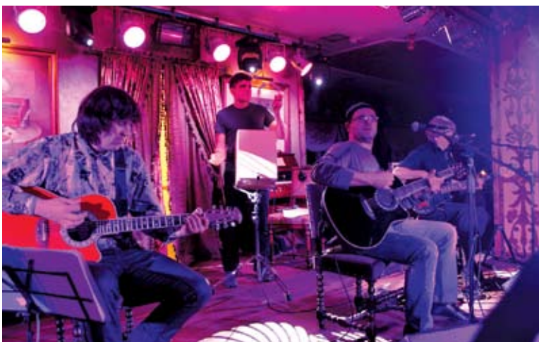
„RusRock.lt“ atliko rusiškų roko grupių hitus

„RusRock.lt“ gyvuoja jau trečius metus ir iš pavadinimo galima suprasti, kad tai rusišką roką atlie-