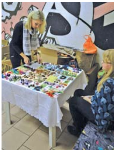
Per renginį buvo galima įsigyti jaunujų menininkų rankų darbo dirbinių

rekonstruotos, atnaujintos ir naudojamos pagal kilnią paskirtį – jaunimo neformaliam švietimui.