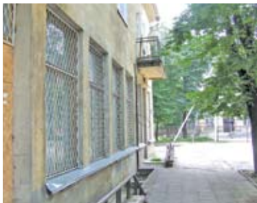
Būstinė yra grotuota, nes anksčiau naktį buvo „madinga“ masiškai daužyti mokyklų, darželių, bibliotekos ir privačių namų langus