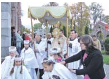
Procesija aplink bažnyčią

Praėjusį sekmadienį LR Seimo pirmininkė Irena Degutienė lankėsi Lentvaryje. Ji dalyvavo 12 val. vykusiose šv. Mišiose Viešpaties Apreiškimo Švč. Mergelei Marijai bažnyčioje.