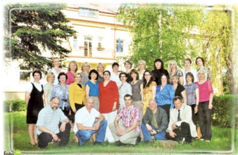
foto Mokytojų ir administracijos darbuotojų susigijimas, todėl stiprus kolektyvas, naudingas šiuolaikinei pedagogikai. Trakų rajone tai vienintelė pradinė mokykla, kurios vaikai vilki uniformas, primenančias, kad jie yra būtent tos mokymo įstaigos vaikai