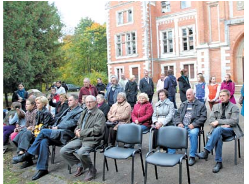
Koncerto dalyvių buvo nedaug: pabūgo lietaus ar apie renginį nežinojo?