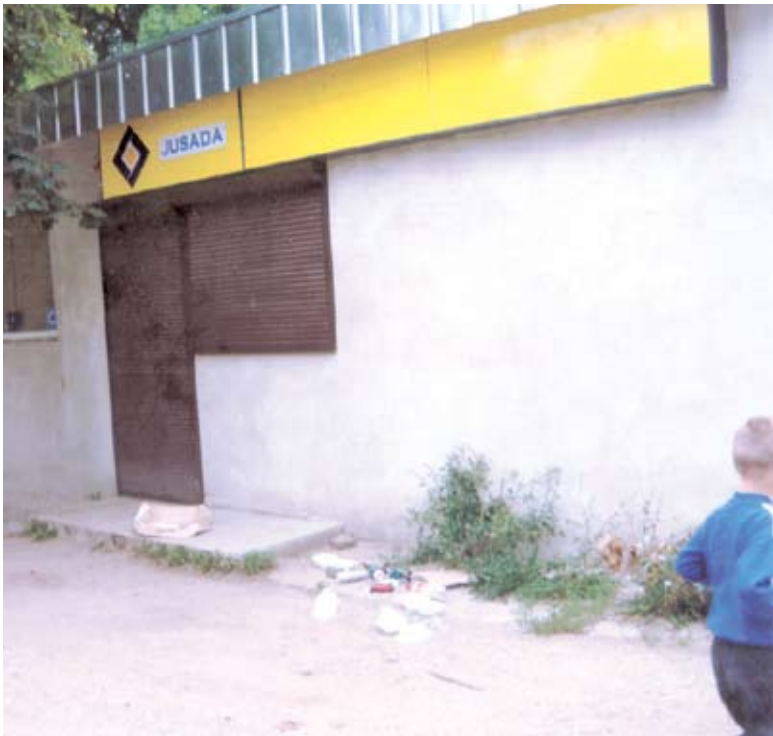
Baras „Jaunystė“ dieną uždarytas, kai gatvėse pilna jaunimo. Tačiau tai visai niekis prieš faktus, jog minėtas baras iš viso negali būti gyvenamųjų namų zonoje

Praejusią savaitę vykusiam Trakų r. savivaldybės tarybos posėdyje nebūta be akibrokštų. Sprendimui dėl Lentvario Lauko g. 19 A esančio baro „Jaunystė“ (priklauso UAB „Jusada Plius“) prekybos alkoholiniais gėrimais laiko apribojimo mūsų atstovaujami tarybos nariai nepritarė. Nebūtų nieko neįprasto, tačiau minėtas baras labiau panašus į naktinės prekybos alkoholiu tašką, įsikūręs daugiabučių namų apsuptyje – vidiniame kieme.