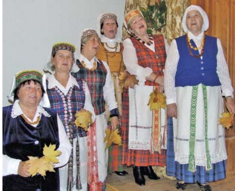
Lentvario senjorų kolektyvo „Klevynė“ atlikėjai

Sekmadienį po šventų Mišių bažnyčioje, išplatinę KA ir TŽ, apsilankėme parapijos namuose, kur buvo pažymėta Tarptautinė pagyvenusiųjų žmonių diena. Koncertavo miesto darželinukai, senjorų kolektyvas „Klevynė“,