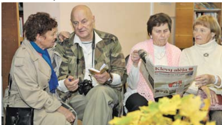
Akimirkos iš laikraščio pristatymo lentvariečiams